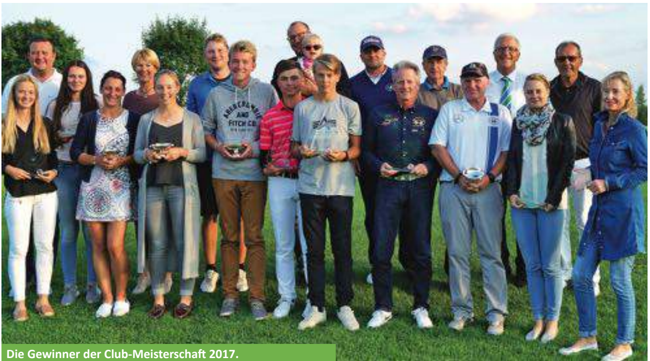
Die Gewinner der Club-Meisterschaft 2017.