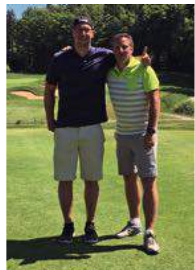
Hartes Training und viel Freude beim Golfspielen.