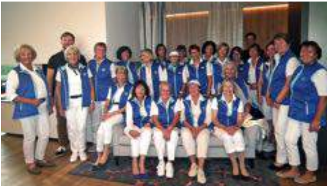
Teilnehmerinnen bzw. Siegerinnen beim JAB-Ladiescup

An den Dienstagen der Ladies glich das Golfen einem Experimentieren mit der Wetterwendigkeit. Die Golfsaison 2017 verlangte neben guten Schlägen und gelungenen Putts eine gesunde Portion an Humor, Optimismus und Gelassenheit. Was die Ladies auch bewiesen durch rege Teilnahme an unterschiedlichen Turnieren, an kulturellen Veranstaltungen, Wanderungen und durch Mitwirken beim geselligen Beisammensein.