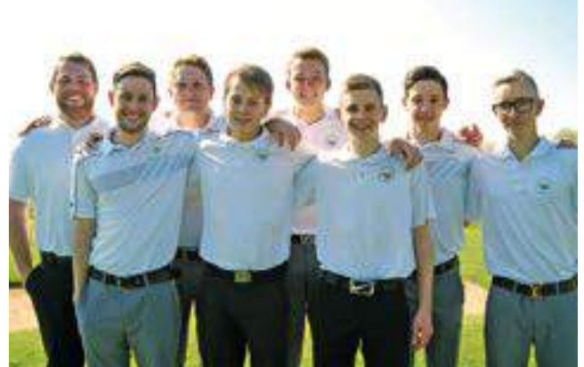
Die Herrenmannschaft des Golf Clubs Hetzenhof möchte zurück in die Oberliga.