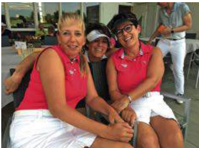
Das Wir-Gefühl ist groß.