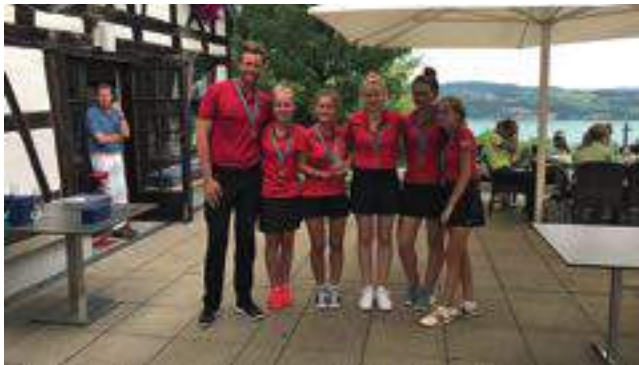
Die erfolgreichen AK16-Mädchen des Golf Club Hetzenhof.

Die AK16 Mannschaft der Mädchen spielte an beiden Tagen sehr starke Ergebnisse und konnte einen tollen dritten Platz feiern. Die AK18 Mädchen waren sich ihrer schwierigen Aufgabe bewusst, alle drei Top-Teams waren auf Augenhöhe und so musste die Tagesform über den Titel entscheiden. Leider hatten wir am Ende nicht das Glück auf unserer Seite, holten zwar einen tollen dritten Platz, verpassten aber das Ziel das Bundesfinale „DOHOIM“ wegen zwei Schlägen.