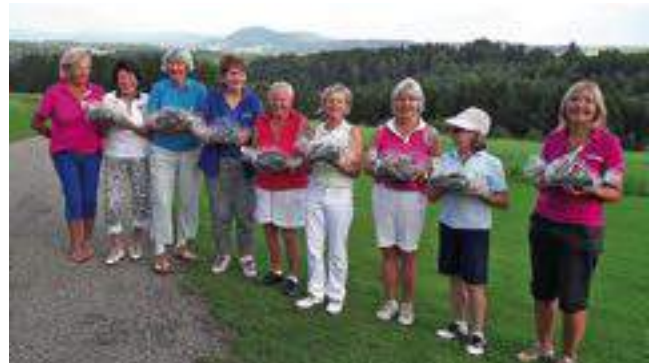
Hüttenzauber vor der Kulisse „Rechberg“

Getrübt wurde die Freude auf das Angolfen im April. Wegen Schneeregen fiel dieses buchstäblich ins Wasser. Auch der erste Start der dreigeteilten Peter-Hahn-Ladies-Golftour wurde aufgrund unwetterartigem Niederschlag auf 9-Loch reduziert. Erst