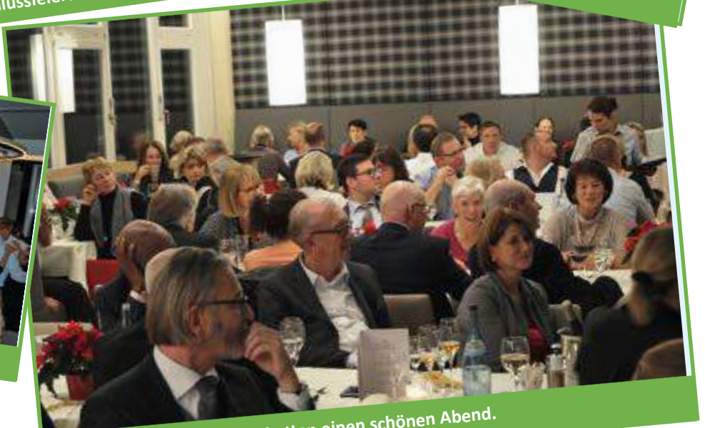
Die Clubmitglieder hatten einen schönen Abend.