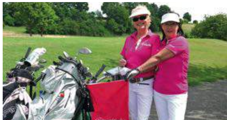
Eine komplette Ausstattung schadet nicht.