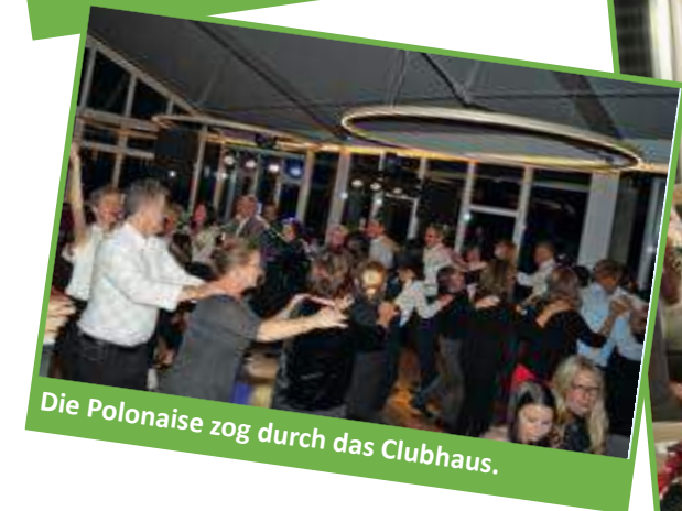
Die Polonaise zog durch das Clubhaus.