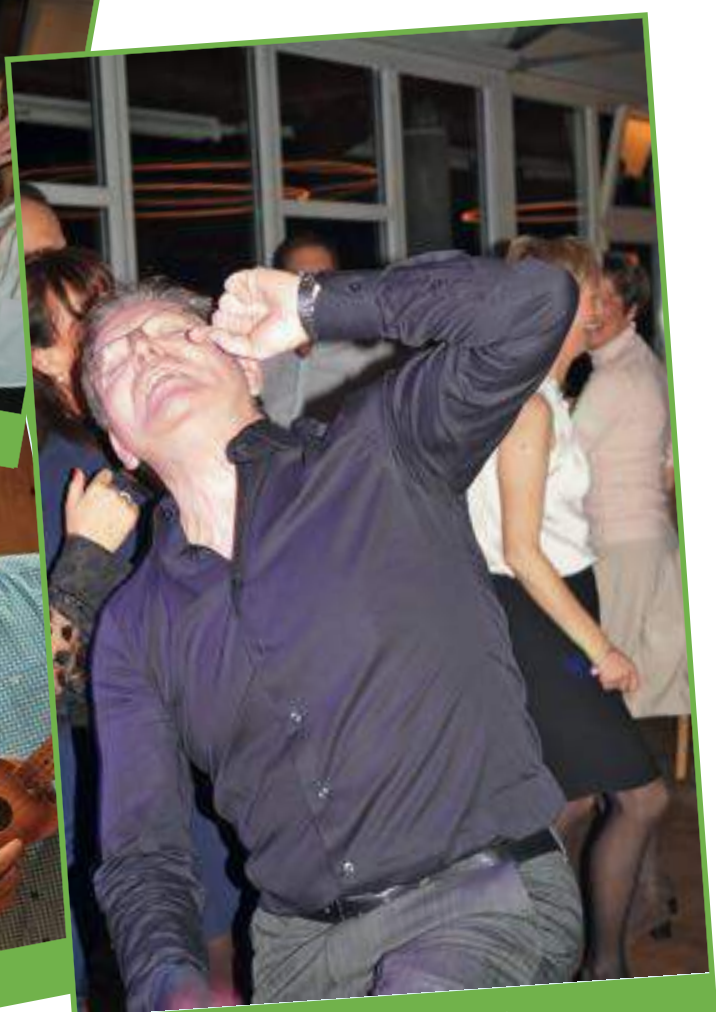
Bis tief in die Nacht wurde gefeiert.