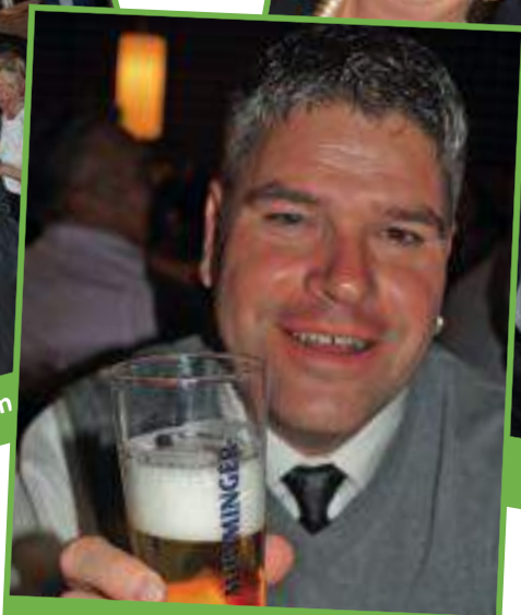
Wir wünschen allen ein schönes neues Jahr 2018!