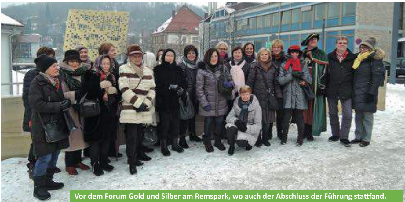
Vor dem Forum Gold und Silber am Remspark, wo auch der Abschluss der Führung stattfand.

konditorischer Köstlichkeiten brillierten die Damen dann beim Datschi-Turnier.