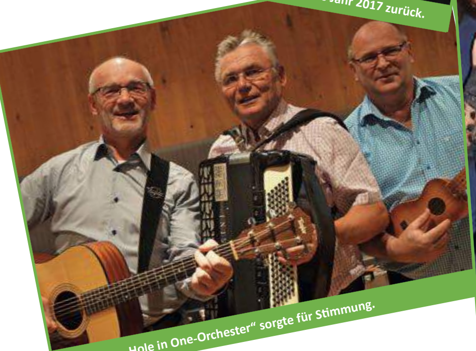
Das „Hole in One-Orchester“ sorgte für Stimmung.