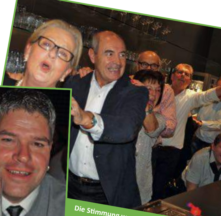
Die Stimmung war großartig.