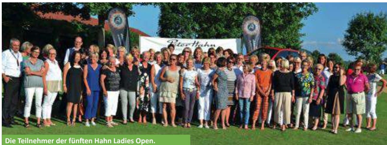
Die Teilnehmer der fünften Hahn Ladies Open.