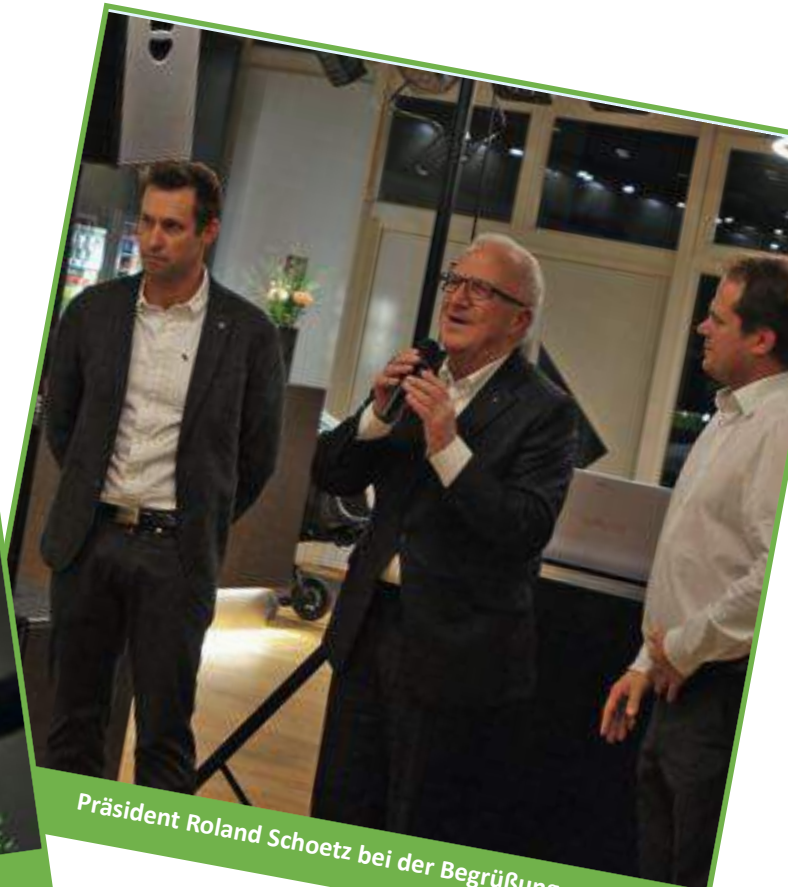
Präsident Roland Schoetz bei der Begrüßung.