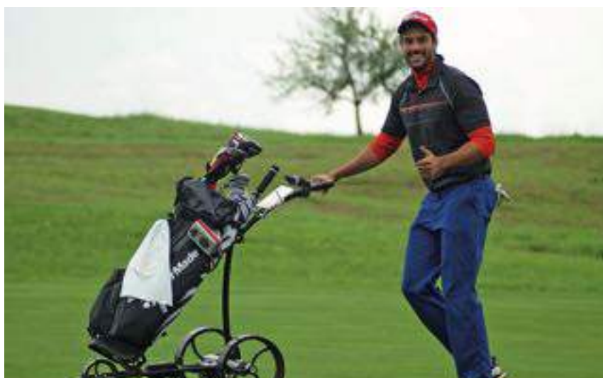
Daumen hoch für die tollen Clubmeisterschaften.

Wir gratulieren allen Siegern nochmals recht herzlich und bedanken uns für die Teilnahme. Ein besonderer Dank geht an unsere Clubgastromonomie, welche die Teilnehmer über alle drei Tage mit köstlicher Halfwayverpflegung und einem tollen Abschlussgrillen verwöhnte. AW