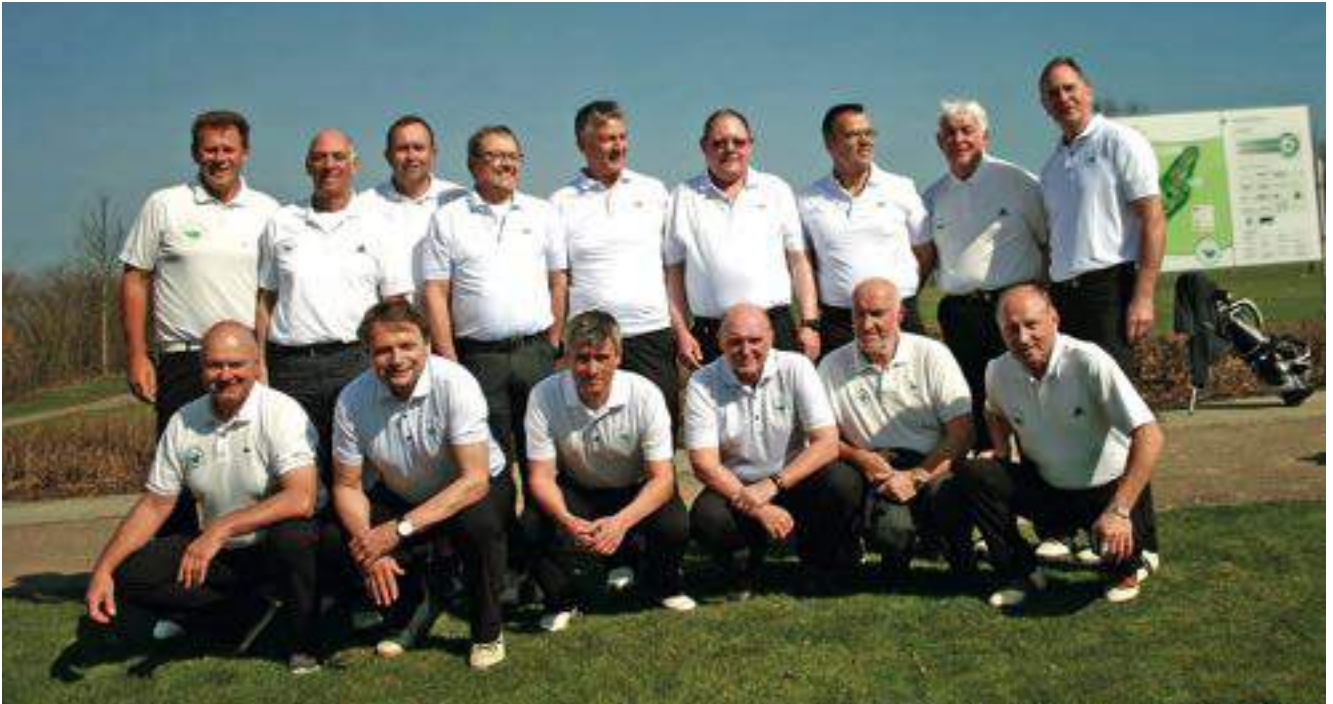
Die Herren AK 50 suchen noch personelle Verstärkung.

In der Saison 2017 spielten unsere beiden Herrenmannschaften der AK 50 des GC Hetzenhof in der 3. Liga des BWGV. Aus einem Kader von 19 Spielern kamen an den fünf Spieltagen insgesamt 18 Männer zum Einsatz.