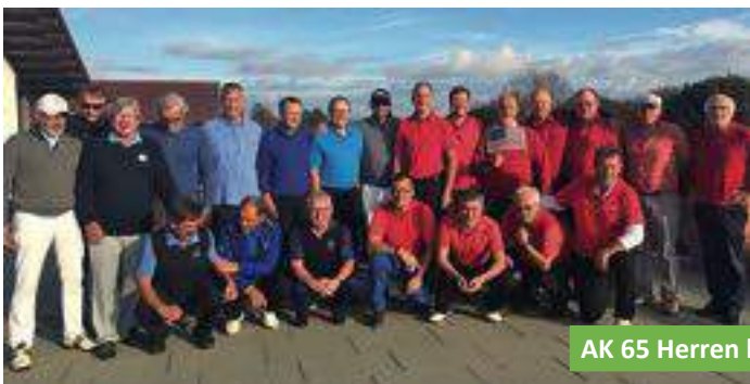
AK 65 Herren beim Ryder-Cup.