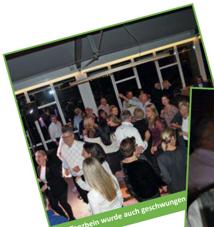
Das Tanzbein wurde auch geschwungen