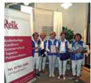
Ein kleiner Umtrunk auf der Wanderung zum Sponsor Reik.