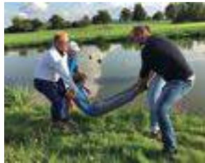
Eindrücke von den Clubmeisterschaften des Golf Club Hetzenhof.