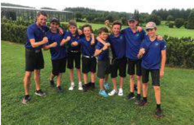
Die AK14 Mannschaft der Jungen sorgte mit ihrem nicht erwarteten vierten Platz für eine kleine Überraschung, spielen doch fast alle Jungs auch 2018 noch für dieses Team.