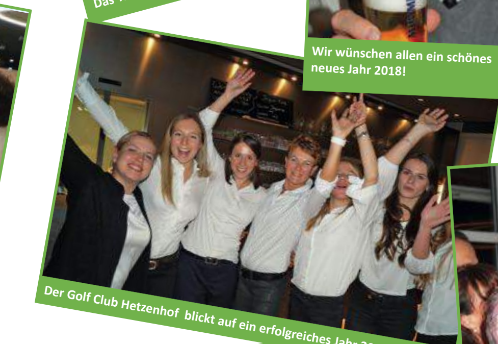
Der Golf Club Hetzenhof blickt auf ein erfolgreiches Jahr 2017 zurück.