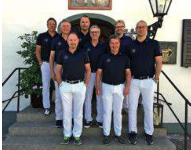
Das Team der Herren AK 30.

In den ersten beiden Ligaspielen am Haghof und in Liebenstein – die zeitlich vor dem Trainingslager lagen – lieferten zu viele von uns katastrophale Ergebnisse ab und wir gingen jeweils als Letzter vom