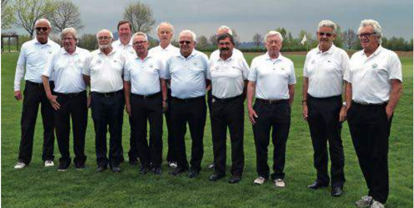
Das erfolgreiche Team der Herren AK 65

Nachdem unsere Mannschaft in den Gruppenspielen dominiert und den Gruppensieg souverän erreicht hatte, ging es am 21. September 2017 auf der Golfanlage Schloss Nippenburg um den Aufstieg in die 2. Liga.