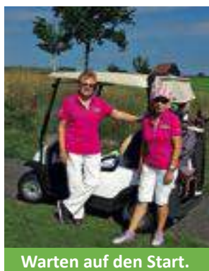
Warten auf den Start.