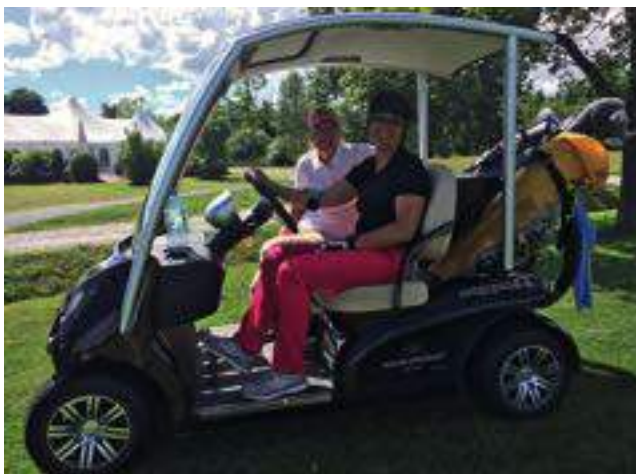
Der Spaß kommt nie zu kurz.